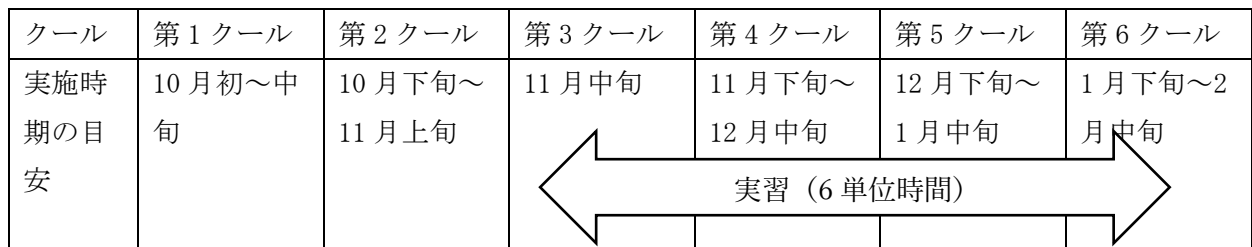
＜子ども初任コースのスケジュール（目安）＞

各地域（ブロック）によって実施時期・内容・方法が異なりますが、合わせて6単位時間実施します。 詳細は第二次案内でご確認ください。